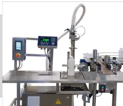
Table pondérale avec table d'accumulation