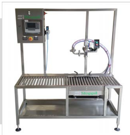
Table pondérale sur rouleaux