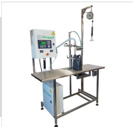
Table pondérale standard