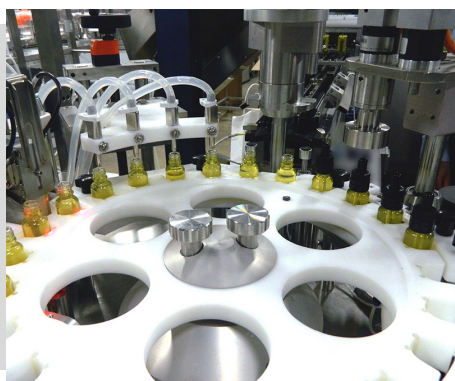
Monobloc 4 têtes de remplissage et 1 tête de vissage