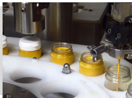
Monobloc 1 tête de remplissage et 1 tête de vissage